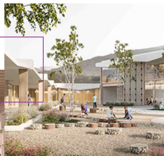
Projet - vue partie maternelle