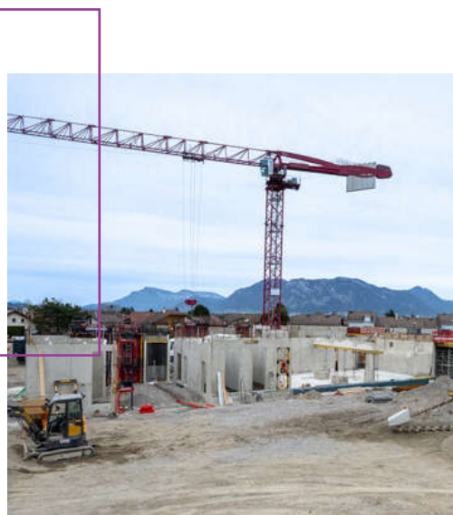
Avancement des travaux (juillet 2024)

Afin que ce bâtiment réponde aux spécificités d'utilisation, les professionnels de la petite enfance ont été sollicités, notamment sur l'aménagement intérieur. L'aménagement extérieur a aussi été pensé, avec une véritable réflexion sur la mobilité des enfants et de leurs parents pour accéder au Pôle.