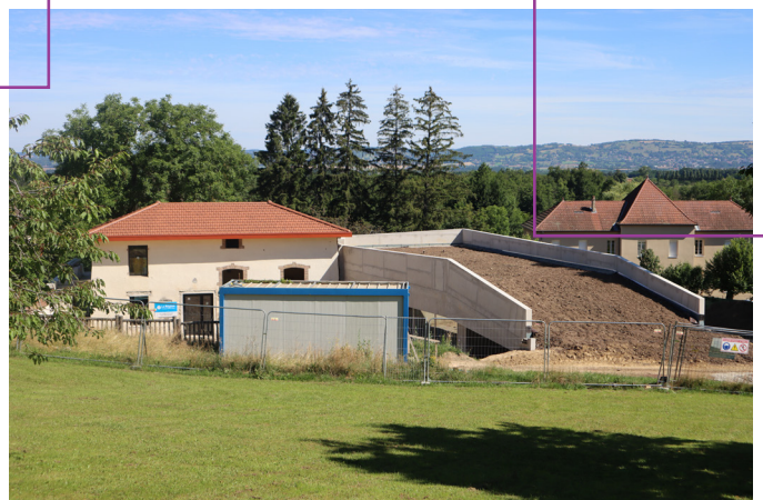
Salle des fêtes en construction